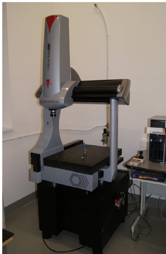
Micro-Hite 3D koordináta mérőgép