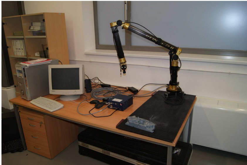
Romer Stinger II csuklókaros mérőgép